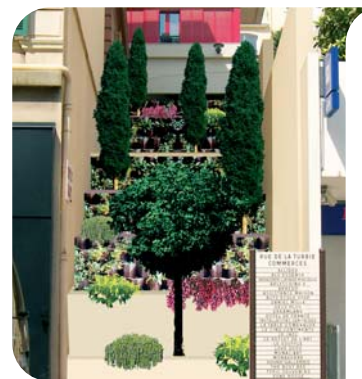
Image de synthèse de l'aspect final du projet

L'ancien escalier reliant la rue Grimaldi à la place des Bougainvilliers fait peau neuve et se transforme actuellement en espace vert. Les travaux ont débuté au mois de septembre et comprennent l'entière réfection de cet ancien lieu de passage qui reliait auparavant la rue de la Turbie et la rue Grimaldi. Le service d'Aménagement urbain (SDAU) en liaison avec le Service des Travaux Publics a entrepris de créer un espace vert en lieu et place de l'ancien escalier, sur cette portion de moins d'une soixantaine de mètres carrés qui court sur une vingtaine de mètres de long. Après avoir effectué les travaux de gros œuvre et de maçonnerie – création des murettes de jardinières - l'endroit va être orné de multiples plantes vivaces et autres végétaux méditerranéens, également agrémentés de quatre cyprès et d'un bigaradier. Les piétons devront désormais emprunter l'ascenseur qui borde le bureau de poste (rue Grimaldi) ou les nouveaux escaliers qui jouxtent également