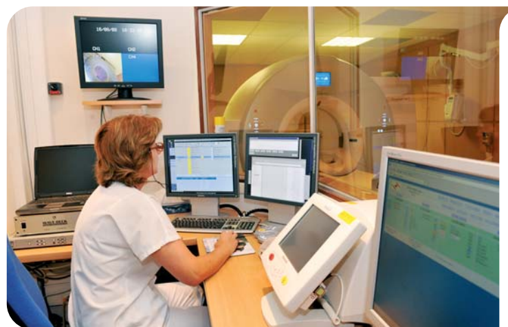
Le Département d'Imagerie Médicale

tes neurologiques (type Parkinson) dont le CHPG s'est fait une spécialité. D'autres équipements, comme les scanners sont également à la pointe des techniques à visée diagnostique et thérapeutique. Ces technologies sont d'une précision et d'une complexité extrêmes qui, au-delà des capacités d'exploration aux confins du corps humain, nécessitent de grandes compétences professionnelles pour les exploiter. Grâce à ces moyens matériels et humains, le CHPG est depuis une quinzaine d'années l'un des leaders dans l'utilisation d'une nouvelle technique : la radiologie interventionnelle. Cette spécialité récente de l'imagerie permet d'utiliser la radiologie à des fins thérapeutiques, en substitution de traitements chirurgicaux classiques. « C'est l'un de nos points forts, confirme