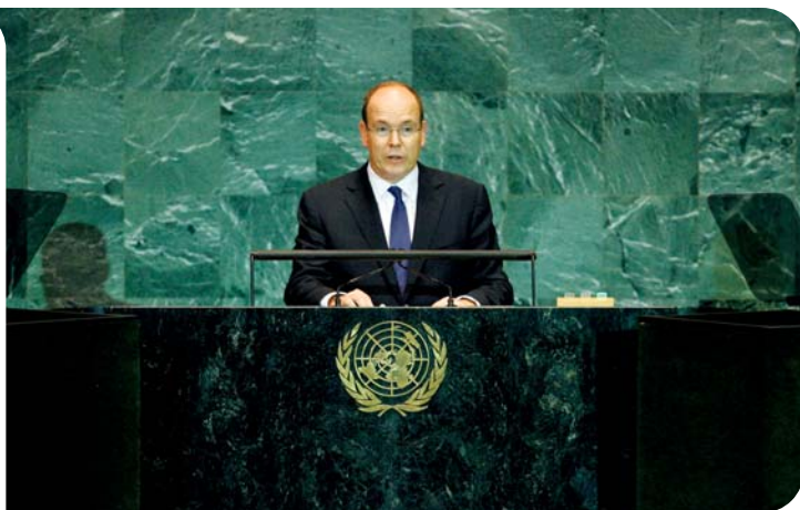
SAS le Prince Albert II de Monaco à la tribune de l'ONU

S.A.S. LE PRINCE SOUVERAIN A CONDUIT UNE DÉLÉGATION À NEW YORK, POUR L'OUVERTURE DE LA 64 e ASSEMBLÉE GÉNÉRALE DES NATIONS UNIES