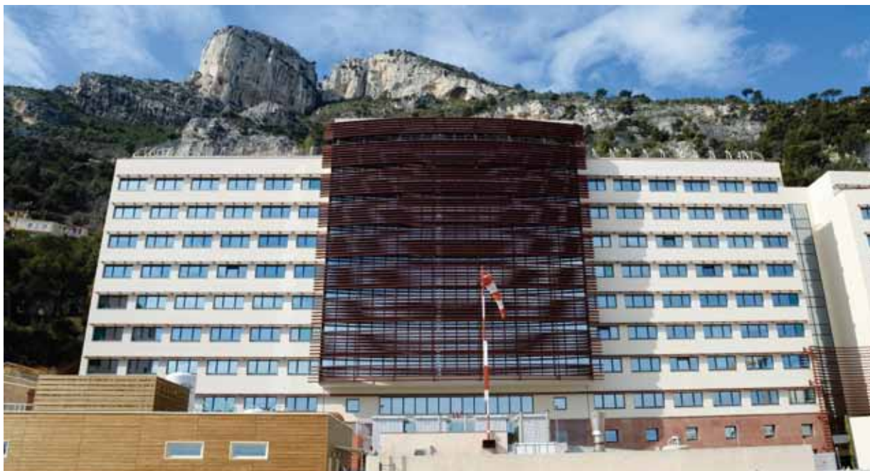
L'activité du Centre Rainier III a cru de façon régulière et rapide dès son ouverture