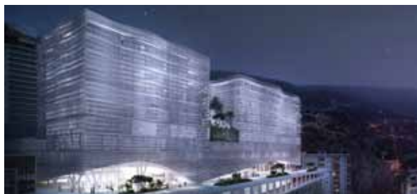
Le nouvel hôpital permettra d'adapter le programme capacitaire aux progrès de la médecine, de réduire les coûts d'exploitation et d'améliorer les fonctionnalités (adaptation à la T2A, tarification à l'activité). Le nouveau CHPG, ultra-moderne, aura entre autres une capacité de 409 lits, tous en chambre individuelle, sur une superficie totale de 74.926 m 2 .

A cette occasion, M. Valeri est revenu sur les moyens mis à disposition de la Principauté pour la mettre au premier rang dans le domaine des soins. M. Valeri a débuté son intervention en rappelant l'excellence de la Principauté dans le domaine des soins médicaux, atout majeur dans son attractivité. L'Etat consacre 8% de son budget au