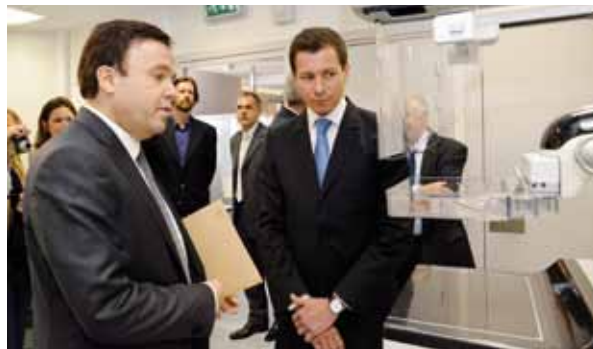
Le nouveau centre d'échographie-sénologie est notamment équipé d'un mammographe à capteur numérique parmi les plus performants du monde.

• la tomosynthèse (équivalent d'un scanner du sein). Elle rend possible l'étude du sein sur des coupes millimétriques, ce qui optimise toute détection précoce.