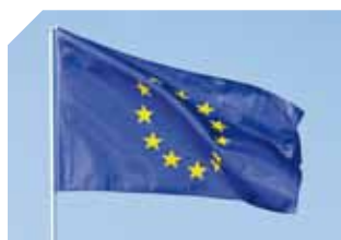
ME – La préparation des négociations avec l'U.E.

La sécurité, c'est la priorité numéro un ! Comme chaque année, afin de prévenir les risques liés à la course, l'Automobile Club (ACM) organise, conjointement avec le Corps des Sapeurs-Pompiers (CSP), les journées de formation des quelques 650 commissaires de course qui seront en action, le Jour J, tout le long du circuit.