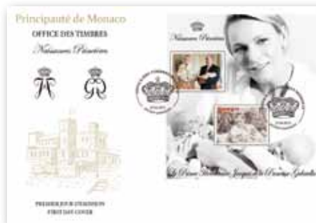
L'Office des Timbres propose également une enveloppe « premier jour d'émission » spéciale au tarif de 4,60 €. L'illustration représente les monogrammes des Enfants Princiers ainsi que le Palais imprimé en encre métallique dorée.

Ce bloc sera vendu exclusivement par l'Office des Emissions de Timbres-Poste, le Musée des Timbres et des Monnaies, et dans le réseau de vente de la Principauté, au prix de 4,00 €. Il sera proposé aux abonnés et clients conjointement aux autres valeurs du programme philatélique de la première partie 2015.