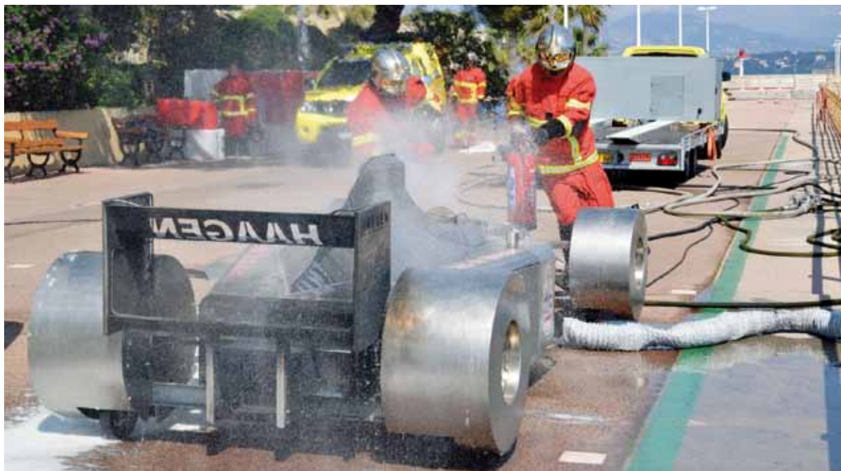
La digue de Fontvieille est spécialement aménagée pour l'évènement. À cette occasion une glissière de sécurité identique à celles du circuit est installée. Les Sapeurs-Pompiers, puis les Commissaires de Courses peuvent donc s'entraîner dans des conditions quasi-réelles. Cet apprentissage annuel permet aujourd'hui aux Secours de pouvoir désincarner un pilote accidenté en moins de deux minutes.

Comme chaque année la Principauté se prépare à accueillir les pilotes de Formule 1 pour le Grand Prix de Monaco. Afin de prévenir tout accident éventuel, l'Automobile Club (ACM) organise, conjointement avec le Corps des Sapeurs-Pompiers (CSP), les traditionnelles journées de formation des quelques 650 commissaires de course qui seront disposés tout autour du circuit. En amont, les Sapeurs-Pompiers sont eux aussi formés et revoient leurs acquis fondamentaux. Reportage.