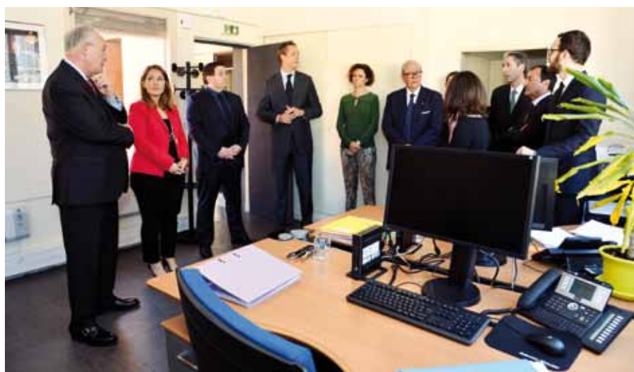
On April 21st, S.E. M. the Minister of State visited the premises of the «Cellule Europe» located in Monaco-Ville at 9 rue Princesse Marie de Lorraine.