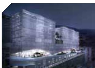
DASS – L'attractivité médicale en Principauté