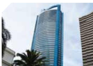
FIN – Les dossiers de l'Administration des Domaines