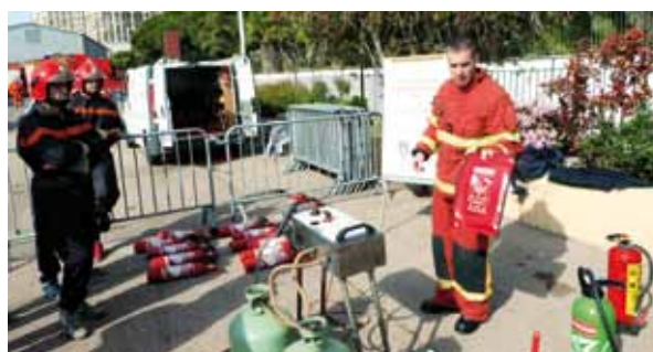
Environ 50 nouveaux Commissaires de course intègrent l'équipe de l'Automobile club chaque année. Comme pour les Sapeurs-Pompiers, ces deux jours de formation, pour les commissaires, sont l'occasion de se remémorer les fondamentaux pour les anciens et de se familiariser avec des techniques et des outils inconnus pour les nouveaux.