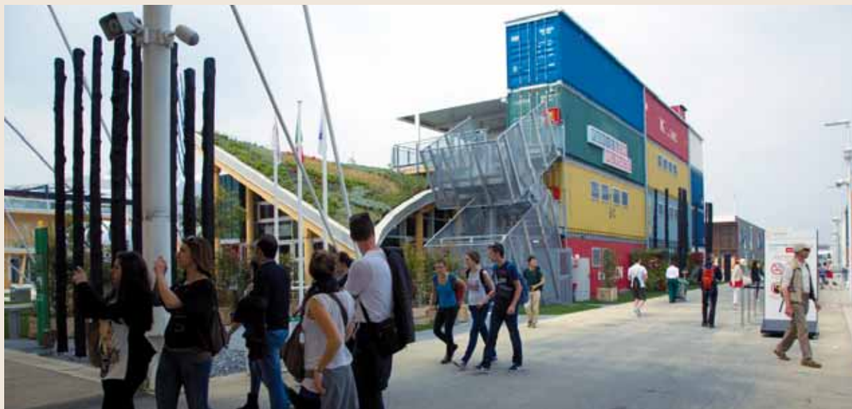
Le Pavillon Monaco élaboré par Enrico Pollini est conçu autour de trois symboles forts. Des containers, modules de transport international, qui composent la structure forte du Pavillon. Une toiture en forme de toile de tente, qui représente l'abri fondamental. Un jardin suspendu dont la couverture végétale de 500 m 2 symbolise la terre nourricière.

L'Exposition Universelle Milano 2015 a ouvert ses portes le 1 er Mai dernier et ce jusqu' au 31 Octobre 2015. Durant ces 184 jours, c'est plus de 130 Pays participants, dont la Principauté, qui exposeront sur le thème « Nourrir la planète, Energie pour la Vie ».