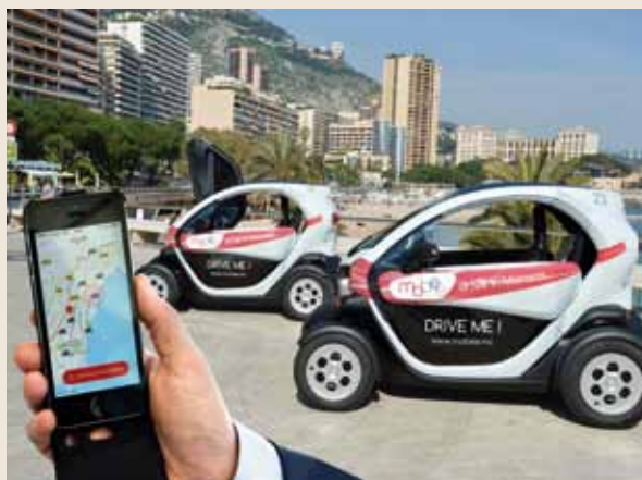
Mobee présente des avantages pratiques, environnementaux et économiques. Ce service participe de la volonté politique d'aller vers une mobilité toujours plus durable en Principauté.