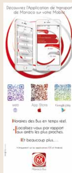
L'application « MONACO BUS » se télécharge sur les boutiques App Store ou Google Play depuis le smartphone. Pour la version WEB, le lien Internet est le suivant : http://lhoraires.cam.mt

Enfin, des « QR codes » correspondants à chaque version sont apposés sur les arrêts d'autobus pour faciliter le téléchargement.