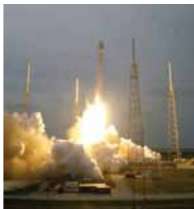
Le satellite TurkmenAlem52E/MonacoSat propulsée dans le ciel de Floride par la fusée Falcon 9.