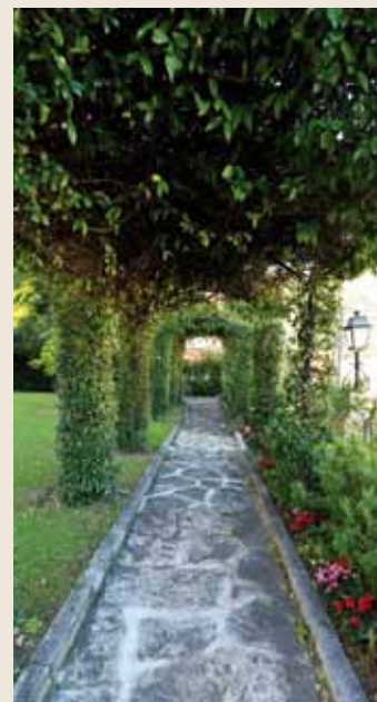
Les édifices religieux et les bâtiments institutionnels traditionnellement ouverts pour cette occasion ont accueilli au total pas moins de 20.000 visiteurs. Ici le jardin de la Résidence du Ministre d'État.

Cette journée a permis aux visiteurs de découvrir, sous un nouveau jour, les principaux jardins de la Principauté mais aussi les arbres remarquables qui ponctuent le territoire monégasque.