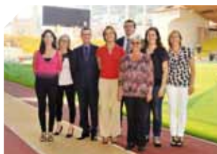
Présentation de l'équipe du Stade Louis II