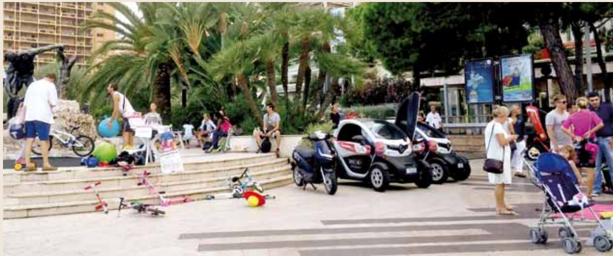
La Compagnie des Autobus de Monaco (CAM) et Mobee ont permis aux participants d'essayer leurs véhicules électriques en libre service, vélos et Twizy. Parallèlement, le 20 septembre, à l'occasion de la Journée des Transports Publics, les bus étaient gratuits sur le réseau de la CAM.

À l'initiative de la Direction de l'Environnement et en partenariat avec le Club des Véhicules Électriques, l'association Monaco Développement Durable (MC2D) et la Mairie de Monaco, la Principauté s'est associée à la Semaine Européenne de la Mobilité qui avait lieu du 16 au 22 septembre dernier.