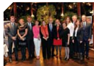
Célébration du 10 e anniversaire de l'adhésion de Monaco au Conseil de l'Europe