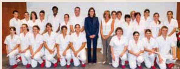
Cette promotion, parrainée par l'Association Mission Enfance, comprenait 29 étudiants ayant suivi une formation de trois ans. Une brillante « Promotion Mission Enfance » : 26 étudiants ont été diplômés, les cinq premiers obtenant sur ces trois ans une moyenne située entre 15 et 17/20