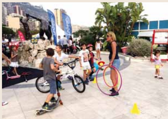
Les 5-12 ans pouvaient également participer avec leur vélo ou leur trottinette à un mini-challenge composé d'un parcours de régularité et d'adresse.

Une action ludique sur le thème de la mobilité était également mise en place pour les enfants durant le week-end du 20 septembre. À l'initiative de l'Institut Méditerranéen d'Études et de Développement Durable (IMEDD),