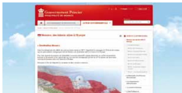
Le film promotionnel et les reportages d'Euronews sont visibles sur www.gouv.mc