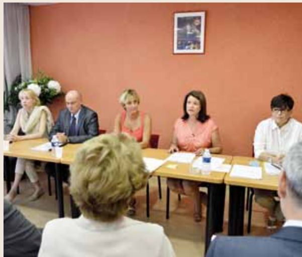
Concernant le domaine du Sport, cette rentrée 2014 a été marquée par la mise en œuvre d'horaires aménagés au lycée Albert 1 er , pour les élèves sportifs de haut niveau. Par ailleurs, les élèves des établissements publics de la maternelle à la terminale portent depuis le 8 septembre dernier, une même tenue sportive standardisée.

ration de la filière internationale du lycée Albert 1 er et la nomination d'un « University Counselor », qui aura pour mission de faciliter les inscriptions des jeunes monégasques dans les universités américaines et anglo-saxonnes. Enfin, afin d'améliorer la qualité de la restauration scolaire, une cuisine centrale intra muros propose désormais aux élèves demi-pensionnaires , des repas de meilleure qualité, élaborés dans des conditions d'hygiène et selon des procédures de conditionnement irréprochables.