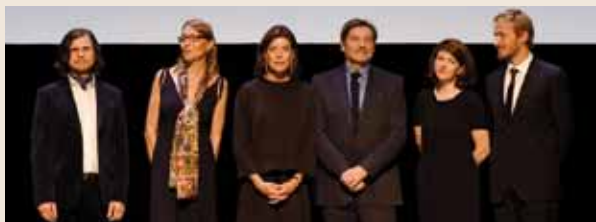
S.A.R. la Princesse de Hanovre entourée des lauréats lors de la cérémonie de remise des prix