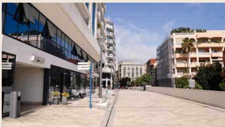
L'intégralité des commerces, au nombre de onze, sont aujourd'hui tous ouverts et accueillent des activités dans des domaines variés tels que la petite restauration, le sport, les vêtements, les activités ludiques et artistiques, en cohérence avec le Centre Commercial de Fontvieille et les artères proches (rue Grimaldi, rue de La Turbie, allée Lazare Sauvaigo).

Les commerces sont situés en rez-de-chaussée du complexe « Les Jardins d'Apolline » sur une surface totale d'environ 1.100 m 2 .