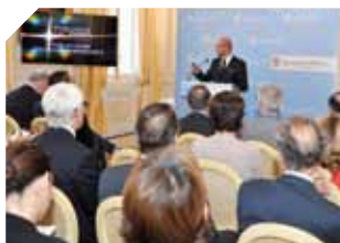
Dossier : la campagne de communication 2014

La Direction du Tourisme et des Congrès a dressé un bilan positif de la fréquentation touristique à Monaco pendant l'été. Avec un taux d'occupation dans les hôtels avoisinant les 80 %, la Principauté est toujours aussi attractive. Le nombre considérable de touristes, pour le Concours International de Feux d'Artifice Pyromélodiques, en est la preuve.