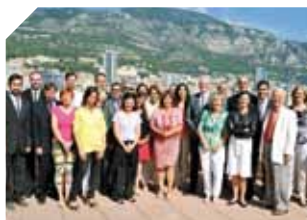
DEEU : les nominations au sein du Département