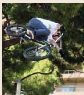
Point d'orgue de la manifestation, un spectacle de vélos acrobatiques « freeride » en BMX et de trial était organisé. Salto et freestyle étaient au rendez-vous pour un show original, en vélo électrique et en musique !

Enfin, le dimanche 21 septembre était dédié au déplacement à vélo en Principauté. Pour cette occasion, l'avenue Princesse Grace était partiellement fermée aux véhicules à moteur afin de permettre à tous, petits et grands, de parcourir une zone sécurisée du quartier du Larvotto.